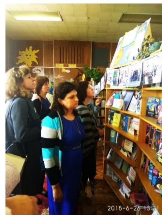
фото на тему «Бібліодозвілля: уміємо працювати, уміємо й відпочивати» . Переможцем стало фото Старокостянтинівської ЦБС під назвою «Ми підкорили Говерлу!» ;