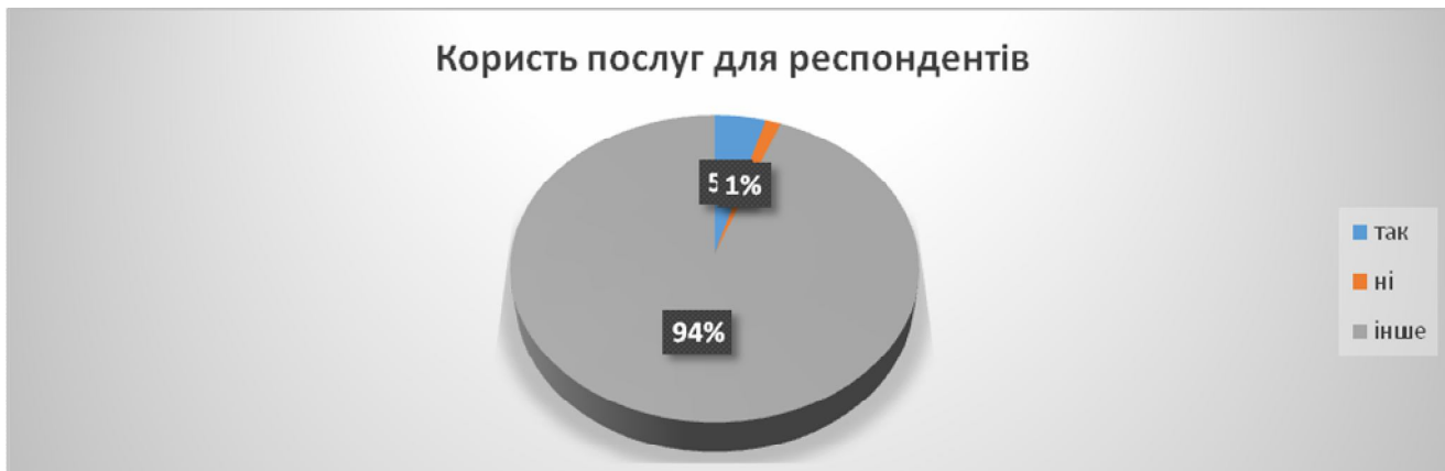
Мал. №5. Діаграма: «Динаміка користі від послуг е-урядування».