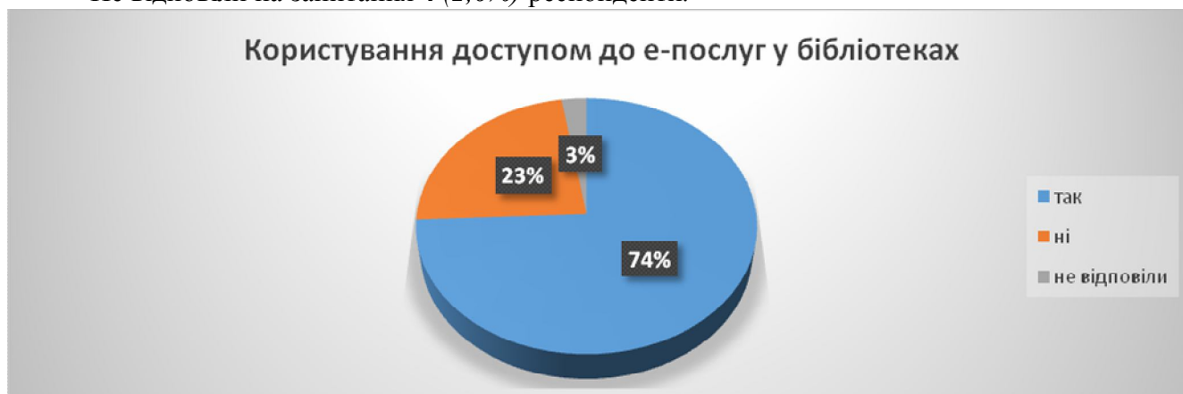
Мал. №4. Діаграма: «Використання респондентами доступу до е-послуг у бібліотеках».

Не відповіли на запитання 4 (2,6%) респонденти.