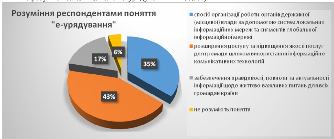
Мал. №3. Діаграма: «Обізнаність респондентів щодо поняття е-урядування».

На запитання: « Навіщо на Вашу думку громаді послуги е-урядування? » респонденти вказали свою думку: (Слід зазначити що на дане запитання, респонденти вказували по декілька відповідей, тому підрахунок відсотків вівся в відношенні від 100% на кожну відповідь.)